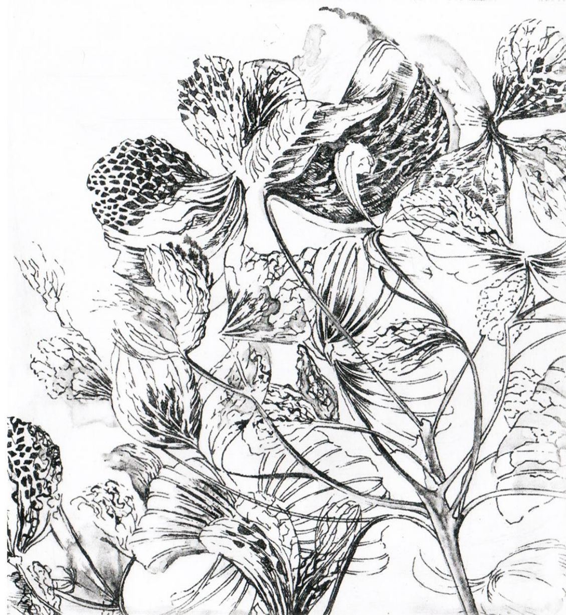
Hortensia photopolymère, gravure

Ode à la vie, à la nature, aux détails qui s'imposent et qui se révèlent, aux formes charnelles et ambiguës et au plaisir de se perdre dans les fragments que j'isole d'un tout.