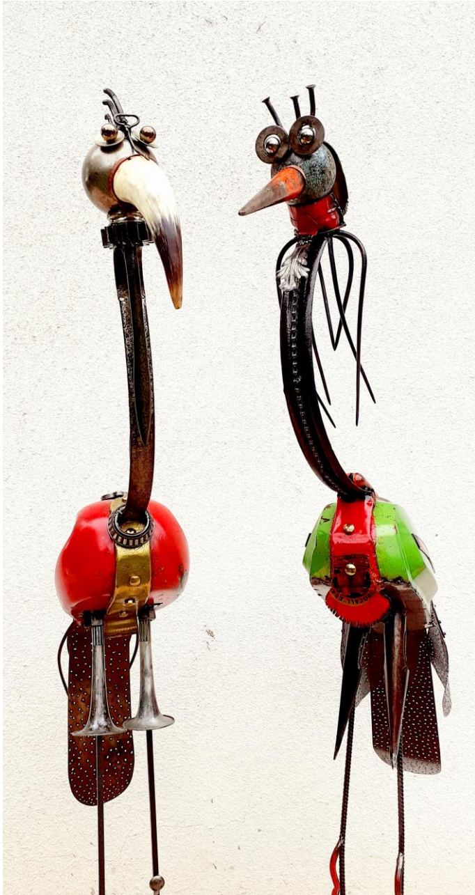
Green day et Red Hot

Menuisier de formation, Daniel Stier se passionne depuis quelques années pour le métal. Plus que jamais dans l'air du temps, sa démarche a toujours été de créer à partir d'objets trouvés, de recycler et d'assembler des pièces échouées sur les plages et dans les caves pour en faire naître de nouvelles. La technique de la soudure métal lui a ouvert de nouveaux horizons et lui permet de réaliser ce que son imagination lui soufflait depuis des années.