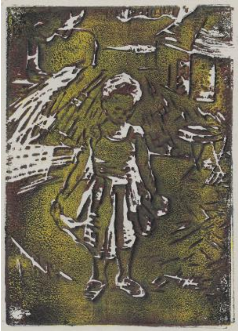
La nouvelle robe linogravure