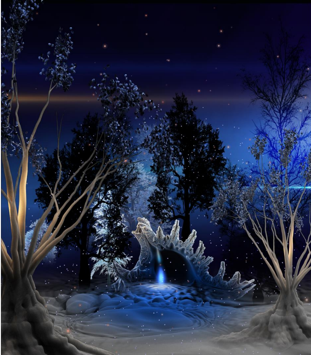
La vidéo Bluma

une immersion en forêt chimérique avec des sons réels de la nature