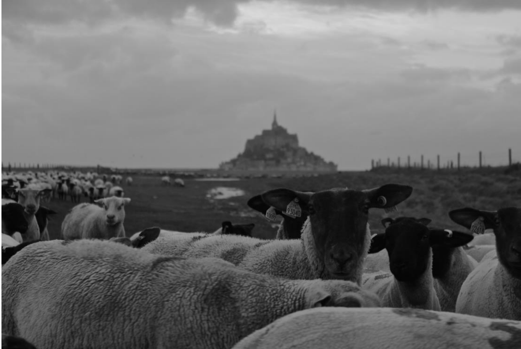
Mont St. Michel, 5 octobre 2020