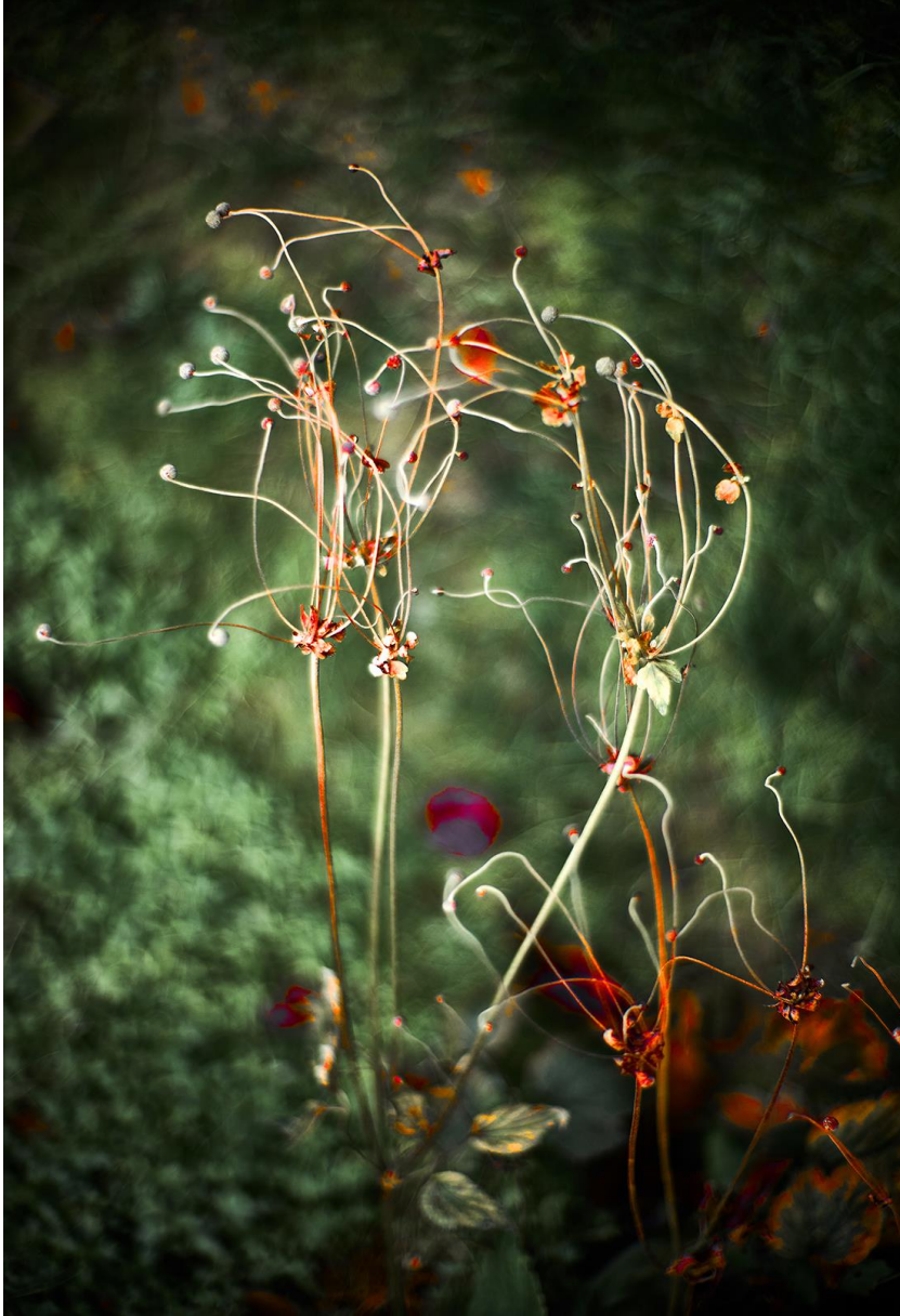
Mortuo Flores, 2020

Cette série est due à la vision du jardin en hiver. Les végétaux qui y poussent m'ont donné à réfléchir sur leurs disparitions et leurs renaissances. Les plantes que je photographie sont, pour la plupart, mortes mais cet état n'est que provisoire et la renaissance se fera au printemps. La mort n'est pas définitive, la nouvelle vie est là, sous nos yeux.