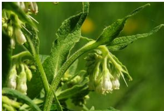
Consoude en fleur