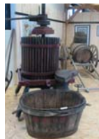
Maison de la Vigne

Le moulin de la Naze (maison de la Meunerie) à Valmondois retrace la vie quotidienne des meuniers de la vallée du Sausseron.