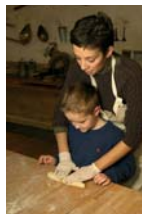
Maison du Pain