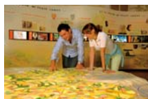
Musée du Vexin français

La vocation agricole du territoire est illustrée au musée de la Moisson à Sagy autour d'une remarquable collection de machines et d'outillage agricoles présentée dans un ancien corps de ferme réhabilité.