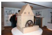
Moulin de la Naze