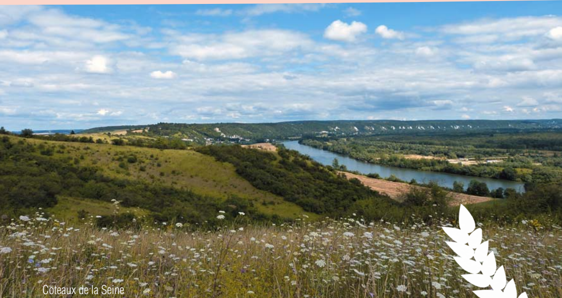
Côteaux de la Seine

dans le Parc naturel régional du Vexin français