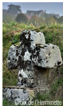
Croix de l'Herminette