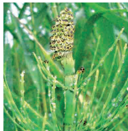
|| Equisetum telmateia