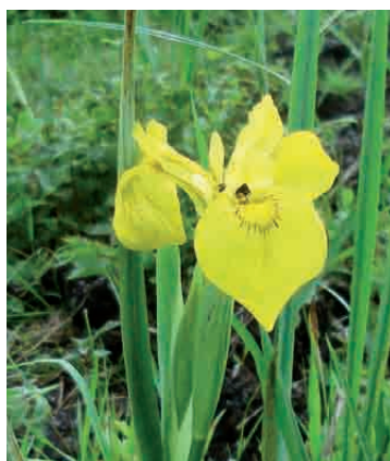
|| Iris pseudacorus