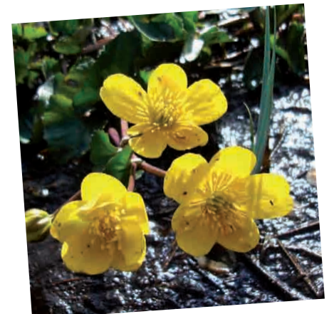
|| Populage des marais

Les mégaphorbiaies sont des peuplements denses de plantes à fleurs hautes qui affectionnent les sols riches. La reine des prés en est une espèce caractéristique. Ces milieux s'installent généralement sur les bordures externes des zones humides.