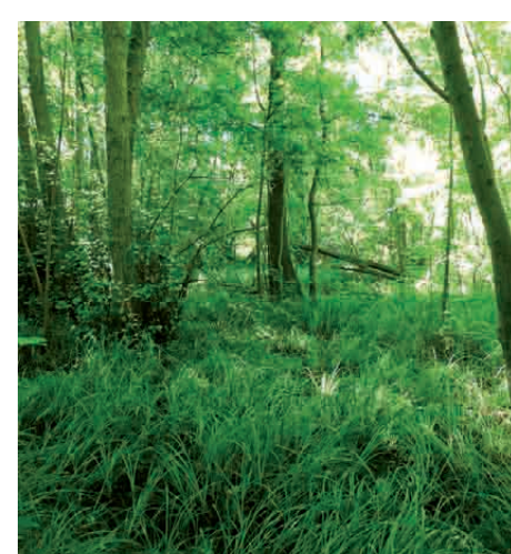
|| Aulnaie à hautes herbes