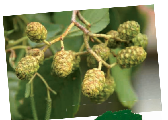
|| Aulne glutineux