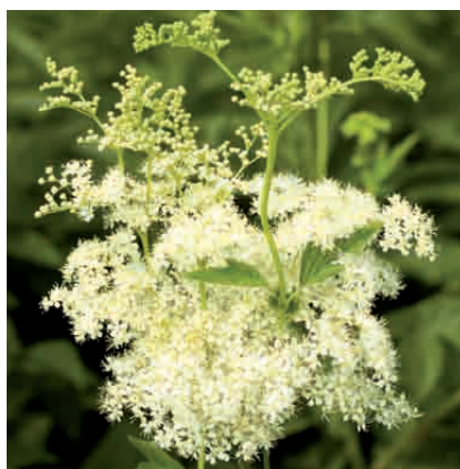
|| Reine des prés