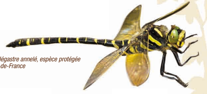
|| Cordulégastre annelé, espèce protégée en Île-de-France

Le fond de vallée du Sausseron est composé d'une mosaïque d'habitats d'intérêt patrimonial adaptés aux sols gorgés d'eau. Les zones humides, autrefois jugées improductives, ont été souvent converties en peupleraies ou drainées. Depuis le début des années 1950, ces espaces ont considérablement régressé en Île-de-France et sont considérés comme rares aujourd'hui.