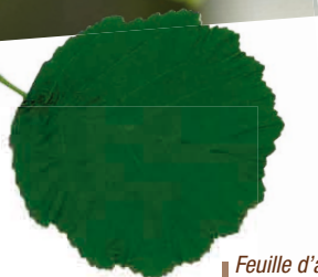
|| Feuille d'aulne