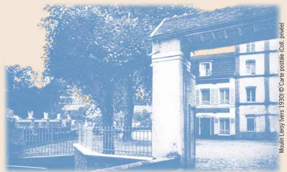
Moulin Leroy (vers 1930)

Au XIX e siècle, le vieux moulin est complété par une grande bâtisse. A cette époque, il est doté d'une roue de type Poncelet de 4,80 m de diamètre, à aubes incurvées pour améliorer le rendement. On y faisait de la farine blanche pour la boulangerie.