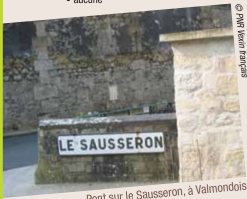
Pont sur le Sausseron, à Valmondois