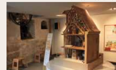
Au moulin de la Naze

pice à la randonnée ou au cyclotourisme. Village résidentiel, Valmondois accueille d'illustres personnalités dont le grammairien Louis-Nicolas Bescherelle, le peintre Maurice de Vlaminck, le caricaturiste Honoré Daumier et Georges Huisman, créateur du Festival de Cannes.