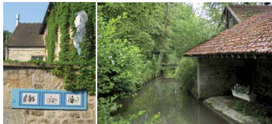
Caricatures de Daumier / Lavoir du Carrouge

• moulins du Sausseron • lavoir du Carrouge • château d'Orgivaux • évocations de Maurice de Vlaminck, Honoré Daumier, Louis-Nicolas Bescherelle, Georges Huisman